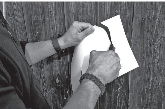
4. Schritt: Schärfe der Klinge mit Papierschnitt prüfen

Ist die erwünschte Schärfe noch nicht erreicht, wiederholt man den ganzen beschriebenen Schleifvorgang. Unbedingt den Winkel zwischen Klinge und Leder (Schritt 1) erneut prüfen.