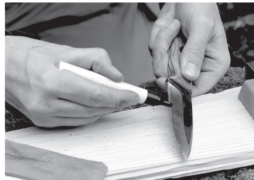
2. Schritt: Die Schneide erhält eine Kontrolllinie

Um während des Schleifens sicherzustellen, dass man den richtigen Winkel beibehält, kann man mit einem schwarzen Stift eine Kontrolllinie auf die Schneide zeichnen. Beim Schleifen mit zu flachem Winkel poliert man nur die Fläche hinter der Schneide und bei zu steilem Winkel wird die Schneide abgerundet. Nach dem Abziehen auf dem Leder erkennt man, ob die Farbe am richtigen Ort abgetragen wurde und der Winkel somit stimmt.