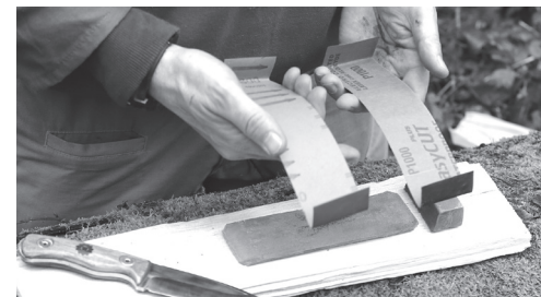
Schleifpapierstreifen zur Entfernung von Ausbrüchen

Sind feine Ausbrüche in der Schneide, dann reicht das Schleifen mit der Paste meistens nicht mehr. Diese entfernt man mit Schleifpapier in verschiedenen Körnungen. Hier