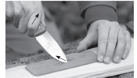
3. Schritt: Ziehbewegung beim Messerschärfen